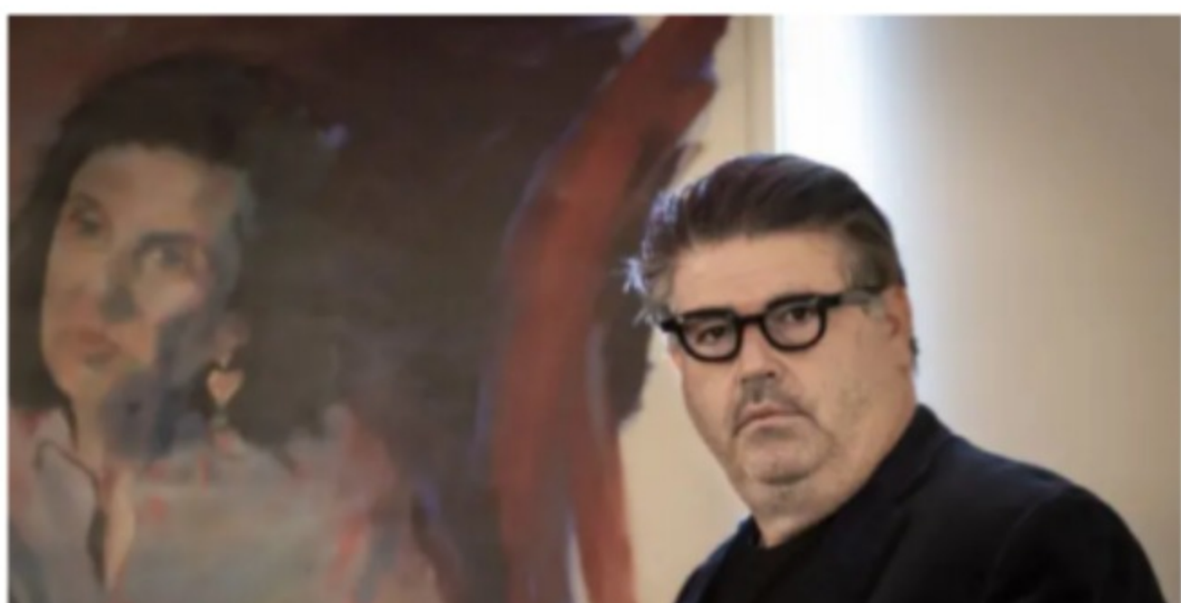
נוסח הידיעה המקורי ב"מעריב", 27.5.21 (צילום מסך)

רהב מיהר לציץ קישור לידיעה, שאינה אלא ההודעה לעיתונות שהפיץ, וצירף לקישור את המילים: "העיתונאי חיים לוינסון יצא שקרן!! (מתן וסרמן: מעריב / צילום: סיון פרג' / עורכים: דורון כהן, גולן בר יוסף)".