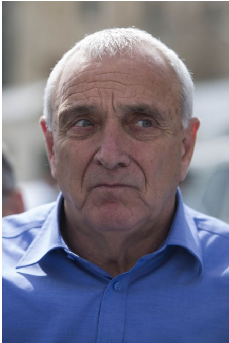
השר לשעבר לבטחון פנים, יצחק אהרונוביץ'

"ברי, כי בהעדר נתונים בסיסיים, אודות כמות ההיתרים שניתנו ביחס לעיתונאים, לא ניתן לדעת האם אכן נעשה שימוש בנוהל המשטרתי לגבי עיתונאים, רק בנסיבות חריגות, שבהן לא ניתן בשל הדחיפות הנובעת מהן, לפנות לבית משפט לקבלת צו שיפוטי, והאם המשטרה עוקפת את החסיון העיתונאי", נכתב בעתירה. "[...] המסקנה הלכאורית, לפיה, לאורך מספר שנים, שום גורם אינו בודק ואינו מפקח על כמות ההיתרים שניתנו ביחס לעיתונאים, הינה בגדר ממצא מטריד ביותר, ואם המדינה לא עשתה זאת, עד כה, אין בכך כדי לפטור אותה לאסוף את הנתונים, לצורך מסירתם לעותרת, וביצוע הפיקוח לעתיד".