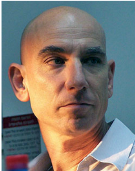
עורך "הארץ" אלוף בן

"חוק האח הגדול" בשל האפשרות שהוא נותן לרשויות החקירה בישראל לקבל "נתוני תקשורת", כגון זהות הצדדים המתקשרים ומיקומם (אך לא את תוכן התקשורת), וזאת לצורכי חקירה. כדי לקבל נתונים אלה יכולים רשויות החוק לפנות לבית-המשפט ולבקש צו שיפוטי, או לחילופין לפנות למסלול "מנהלי" שעוקף את בתי המשפט ומאפשר ל"קצין מוסמך [...] להתיר קבלת נתוני תקשורת", במקרה שבו "שוכנע כי לשם מניעת עבירה מסוג פשע או גילוי מבצעה או לשם הצלת חיי אדם יש צורך, שאינו סובל דיחוי, בקבלת נתוני תקשורת כאמור".