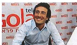
אלופת 2014: גולן טלקום גייסה 137 אלף מנויים גלובס