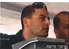
הישראלי המכוער המכללה האקדמית ספיר