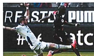
צפו: האם זו הצלחת השנה בכדורגל העולמי?