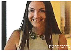
הישראלים פיצחו את השיטה: כך מייצר שוק הנדל"ן האמריקני הכנסה פאסיבית CITYR