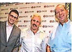
טרנד חדש: הלוואות בין אנשים גלובס